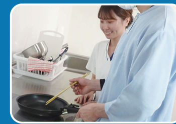
身体障害領域(回復期) 日常生活動作訓練 (新宇都宮リハビリテーション病院)