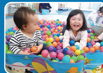
発達領域 遊びを用いた訓練 (こども発達支援センターたんぼぼ園)