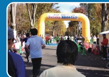
地域領域 地域参加「利用者とマラソン大会参加」 (曙訪問看護ステーション)