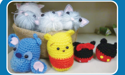
精神科領域 作品創作活動「患者作品」 (那須高原病院)